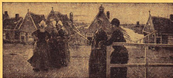
Volendam. — Promenade du soir.

Cotisation annuelle de sociétaire : 3 francs