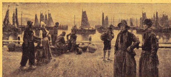
Volendam. — Matinée au port.

Tirage attesté de ce numéro 43,000 exemplaires